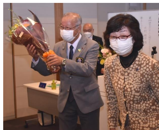
公式訪問、本日すべて終了しました。