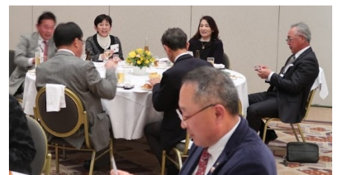
ビンゴゲームを楽しみ盛り上がる