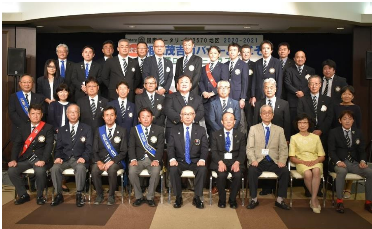
国際ロータリー第 2570 地区ガバナー公式訪問 於:丸広さくら草ホール