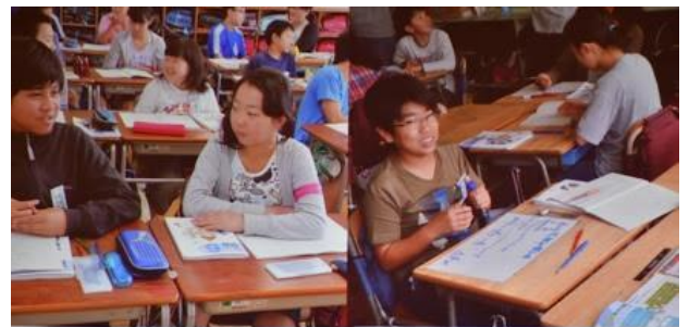
ペア学習、パート練習、観察実験、学び合い学習、ジグソー法、役割演技、課題解決学習、...