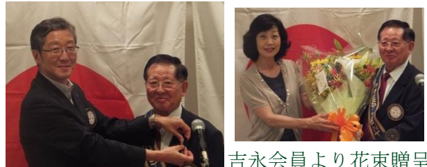
吉永会員より花束贈呈